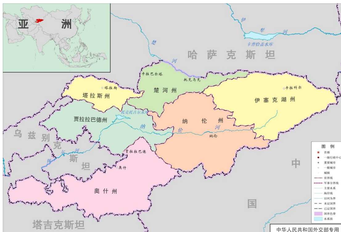
图1 吉尔吉斯斯坦示意图