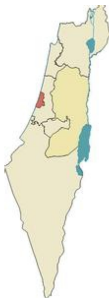
图 1 以色列地图

以色列可划分为 4 个自然地理区域：地中海沿岸狭长的平原、中北部蜿蜒起伏的山脉和高地、南部内盖夫沙漠和东部纵贯南北的约旦河谷和阿拉瓦地。