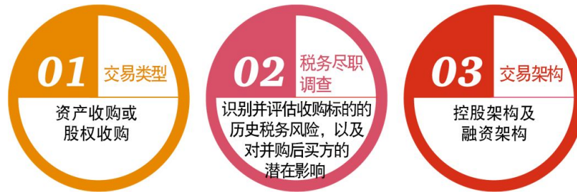
图4 海外并购税务要点示意图

按照常见的海外并购流程，并购前中国企业应该主要关注如下三项税务工作要点，并做好准备：