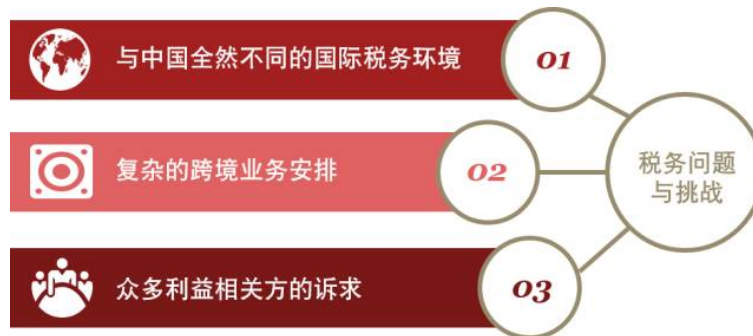
图5 海外工程项目税务特点示意图

海外工程项目也是“走出去”的常见形态之一。海外工程项目有别于国内工程项目存在如下三个主要的税务特征：