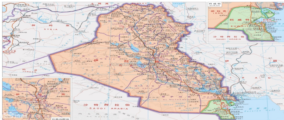
图 1 伊拉克示意图

伊拉克位于亚洲西南部, 阿拉伯半岛东北部。北接土耳其, 东邻伊朗, 西毗叙利亚、约旦, 南连沙特阿拉伯、科威特, 东南濒波斯湾。海岸线长 60 公里。领海宽度为 12 海里。幼发拉底河和底格里斯河自西北向东南贯穿全境, 两河在库尔纳汇合为夏台阿拉伯河, 注入波斯湾。